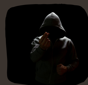
Keskmine lugeja 3,9